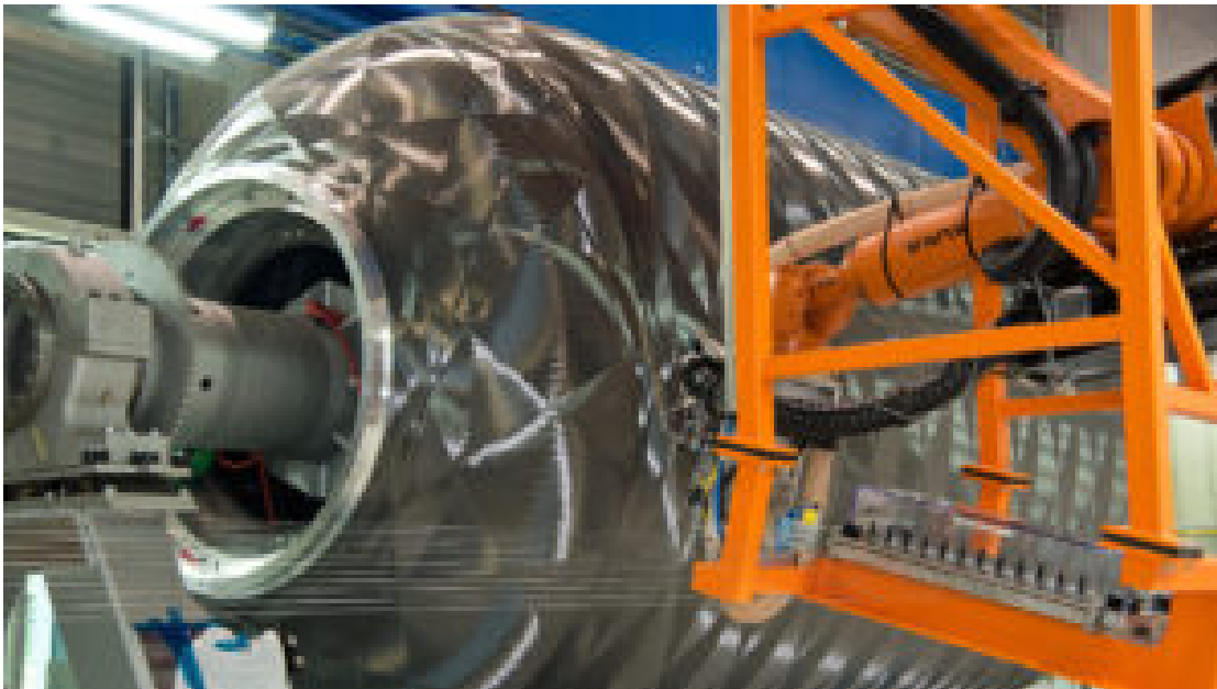
Abbildung 1: Das Boostergehäuse aus Carbonfasern für die Ariane 6 wurde beim DLR Stuttgart und Augsburg in Kooperation mit MT Aerospace entwickelt und gefertigt.

Es ist schon auffallend, welche herausragende Rolle die Booster, die eigentlich ja nur Hilfsraketen sind, in der Diskussion um die Ariane 6 spielen. Die Wichtigkeit, die den Boostern beigemessen wird, scheint darauf hinzuweisen, dass sie noch eine andere wichtige Funktion – eben für die französische Marine – haben, die öffentlich nicht erörtert wird. (16)