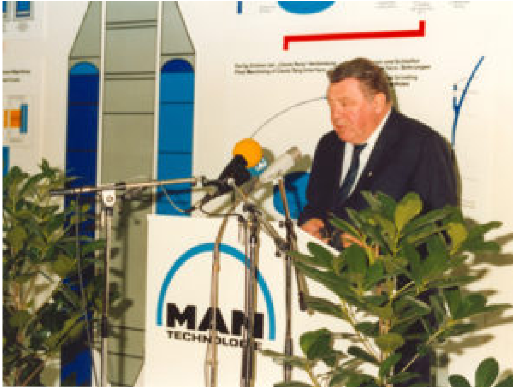
Abbildung 2: Der bayerische Ministerpräsident Franz Josef Strauß spricht bei der Eröffnung der Produktionsstätte für die Ariane 5-Boostersegmente am 30. September 1988 bei MT in Augsburg (ein Tag vor seinem Tod) Foto: Copyright MT Aerospace AG, Eröffnung Fertigung 1988 (Quelle: ESA)