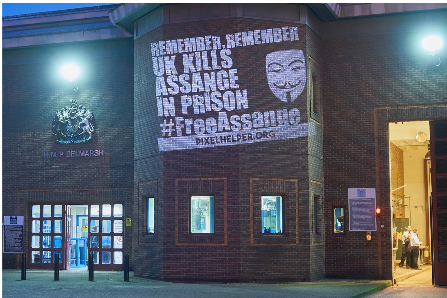
Lichtinstallation für Assange an den Mauern des Hochsicherheitsgefängnisses HMP Belmarsh vom Frühjahr 2020

Offiziell klagt man ihn an wegen Unterstützung Chelsea (damals Bradley) Mannings beim Knacken eines Passworts, er habe zudem Menschenleben durch Veröffentlichung unredigierter Informationen in Gefahr gebracht. Der Beweis, dass jemals jemand durch Assange zu Schaden gekommen ist, wurde jedoch nie erbracht. Da die Auslieferung auf tönernen Füßen steht, wird die Anklage erweitert, erst im Mai 2019, zuletzt im Juni 2020. Man sucht nach Dreck, den man noch auf ihn werfen könnte, aber man findet nichts. Dieser Prozess muss platzen. Assange muss auf freien Fuß kommen. Alles andere würde das britische Justizsystem der Lächerlichkeit preisgeben. Ein